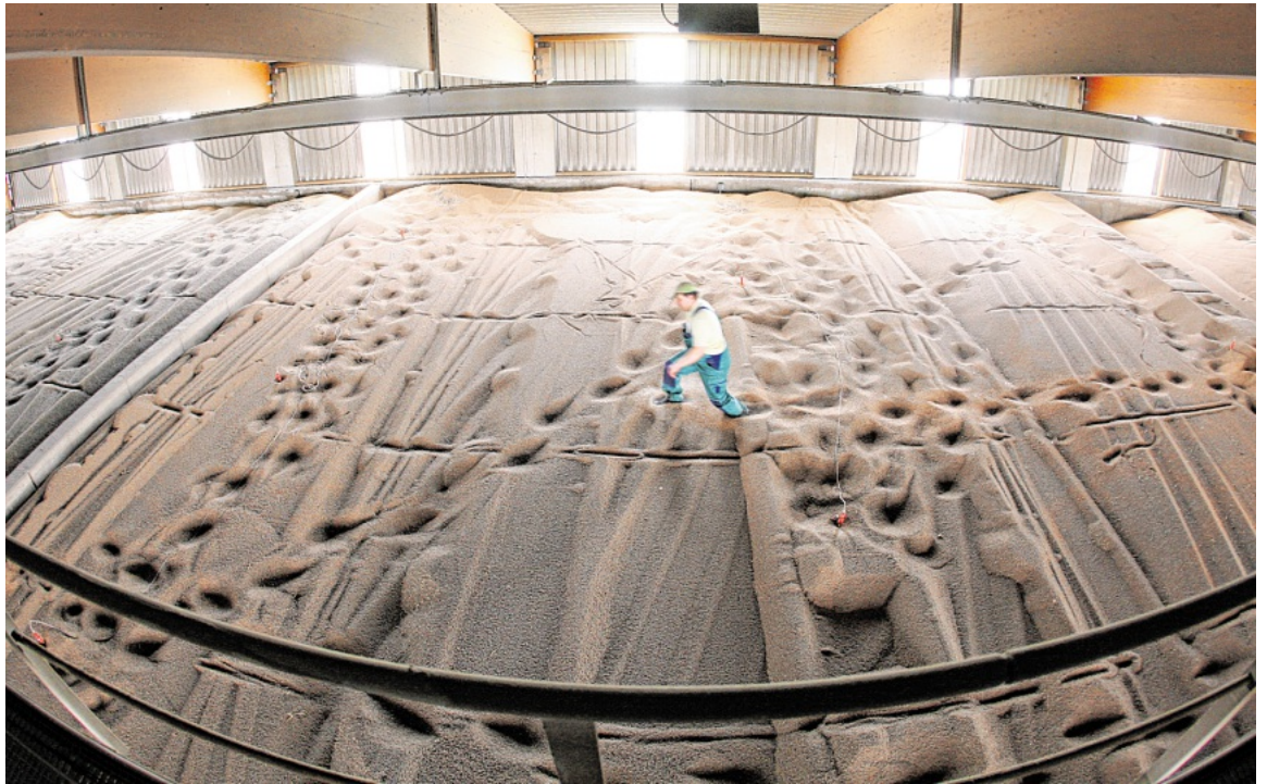
Ein Silomeister steht in einem mit Weizen gut gefüllten, riesigen Getreidesilo einer Raiffeisen-Warengenossenschaft in Norddeutschland.